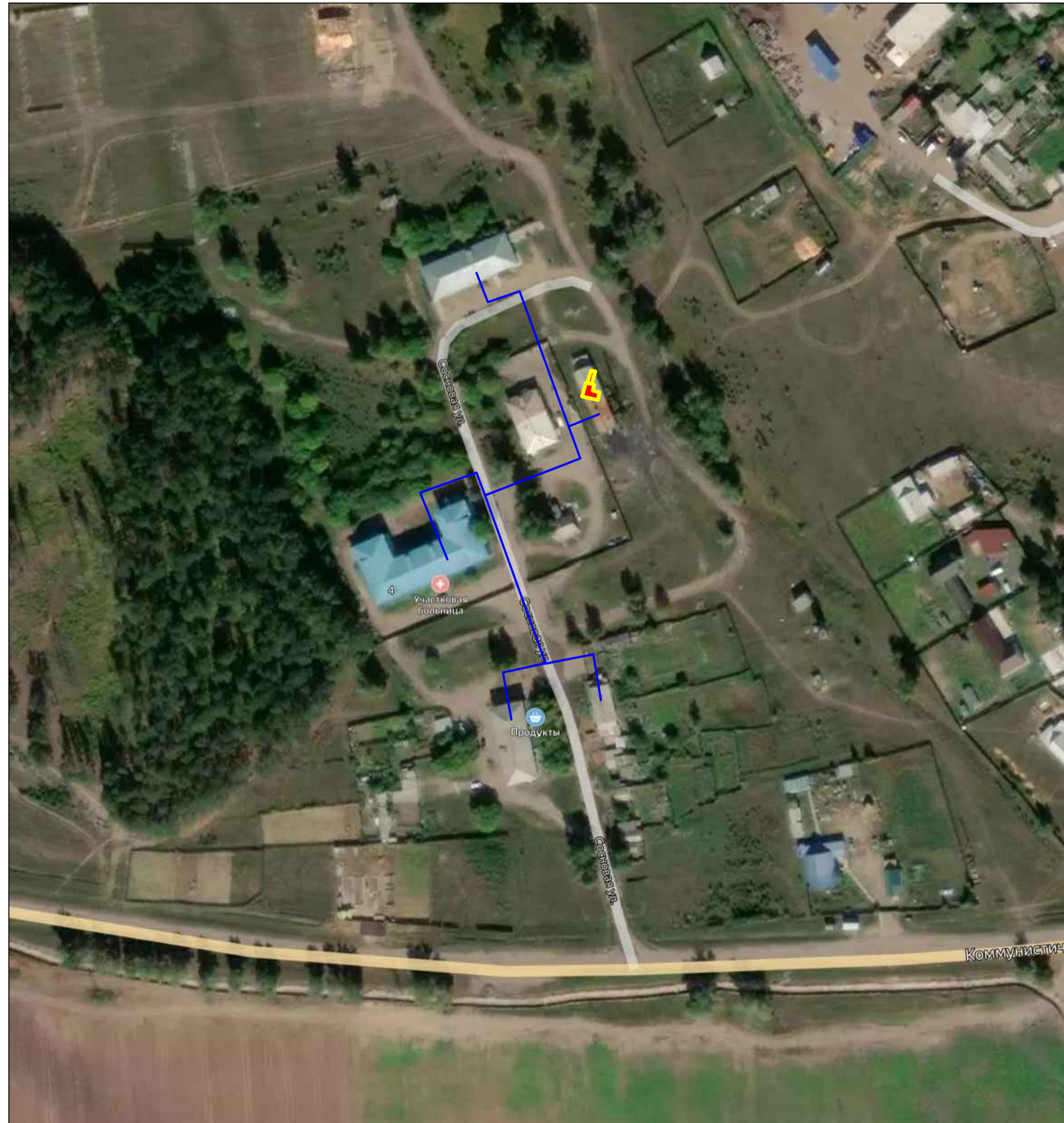
Схема существующего и планируемого водоснабжения с. Ильинка фрагмент территории